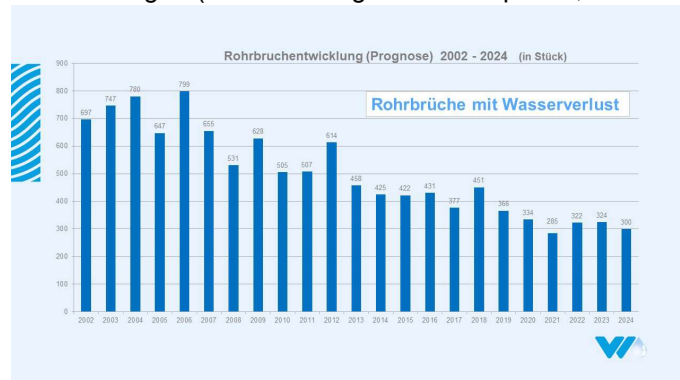
Bild: Die Wasserrohrbrüche konnten seit 2002 signifikant reduziert werden.

Bei der Größe des Bestandes an Rohrsystemen liegt die jährliche Erneuerungsquote mit 0,6 % bis 0,8 % unter den von uns angestrebten 1 %. Es gilt diesen Anteil in den nächsten Jahren zu erhöhen, um langfristig einen dauerhaften und zuverlässigen Betrieb gewährleisten zu können. Aktuell wird dies aufgrund der gestiegenen Aufwendungen (höhere Energie- und Baupreise, höhere