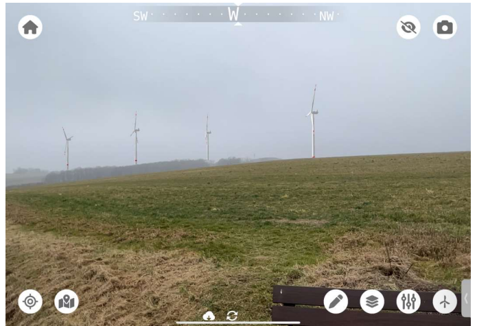
Standort: Ortsausgang Culitzsch