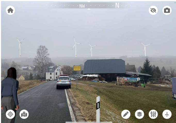
Standort: Kirchberger Straße, oberhalb Gut Tröger

Wir wollten Ihnen trotzdem eine Auswahl Bilder zeigen, um zu zeigen wie stark das Ortsbild dadurch beeinträchtigt wird.