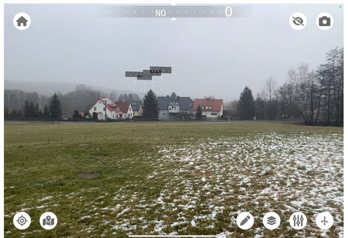
Standort: Schule Hirschfeld