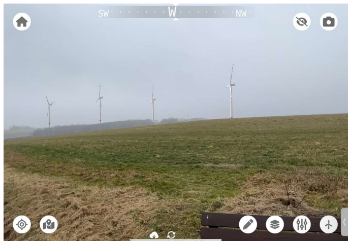
Standort: Ortsausgang Culitzsch

Wie schon oben geschrieben, hatten wir für das Vorhaben schlechtes Wetter. Wir versuchen, einen 2. Termin bei besserem Wetter zu vereinbaren. Der Vorteil liegt dann darin, dass Landmarken zur Orientierung und zum Höhenvergleich verfügbar sind.