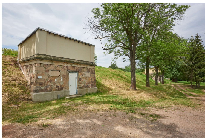
Bild: 52 Trinkwasserbehälter wie dieser sind Bestandteil unserer Trinkwasserversorgung.

Etwa 90 % des Wassers für unser Versorgungsgebiet stellen die Zweckverbände Fernwasser Südsachsen und Fernwasser Thüringen bereit. Das Wasserwerk Burknersdorf, gespeist aus der Talsperre Eibenstock, ist das größte Wasserwerk des Zweckverbandes Fernwasser Südsachsen und stellt ca. 80 % des benötigten Trinkwassers der Wasserwerke Zwickau zur Verfügung. Rund 10 % des verteilten Wassers stammen aus der Thüringer Talsperre Leibis-Lichte. Nach Aufbereitung im Wasserwerk Zeigerheim wird es in der Region Crimmitschau verteilt. Daneben gibt es noch zwei Tiefbrunnen unseres Unternehmens, die täglich rund 2.600 m 3 Trinkwasser für die Region liefern.